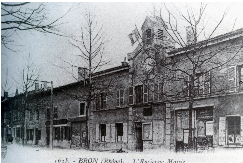
Carte postale de l'ancienne mairie-école de 1876. Photo prise en 1908.

À part son nom, l'on ne connaissait rien de lui. Mais les archives ont parlé. Portrait de celui qui, en 1790, devint le premier maire de notre commune.